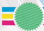
626 Verde Citrus