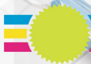
602 Amarelo Flúor