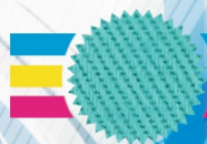
627 Verde Noronha