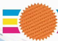
606 Laranja Fiesta